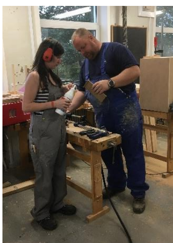
Simone i træ