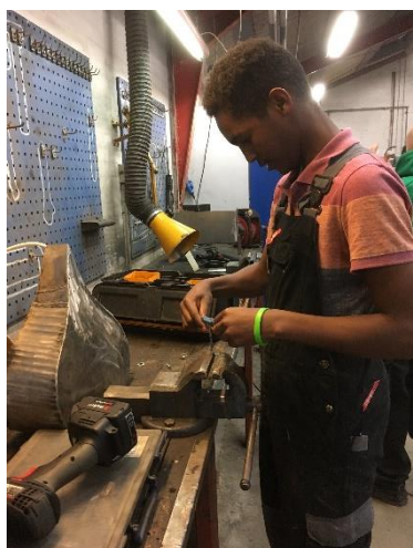
Mohamed i metal