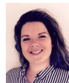
Julie Munk Kreativ/PR